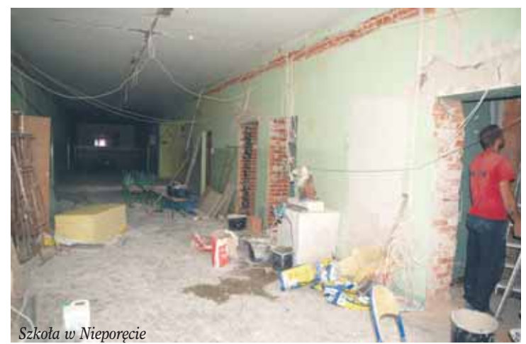
Szkoła w Nieporęcie

Informacje dotyczące referendum znajdują się na stronie www.nieporret.pl, zostaną też zamieszczone w sierpniowym numerze Więści Nieporęckich. □