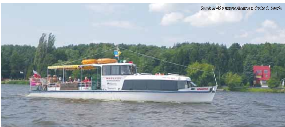
Statek SP-45 o nazwie Albatros w drodze do Serocka

Na Jeziorze Zegrzyńskim można spotkać statek Mewa klasy SP-45, który został zbudowany w 1962 r. w Warszawskiej Stoczni Rzecznej w Warszawie, oznaczono go numerem seryjnym B1/38. W latach 1963-1976 pływał w Przedsiębiorstwie Państwowym Żegluga Mazurska Giżycko, w ekspozyturze w Augustowie. W 1976 r. jego właścicielem stał się Warszawski Okręgowy Związek Żeglarski (WOZZ), z portem macierzystym w Giżycku. Od 1978 r. Mewa pływa po Jeziorze Zegrzyńskim jako statek sędziowski w regatach organizowanych przez WOZZ. Do tej funkcji statek został przystosowany przez zabudowanie rufowego otwartego pokładu pasażerskiego pomieszczeniem zamkniętym, na dachu którego znajduje się stanowisko obserwacyjne dla sędziów regatowych i maszt do wystawiania odpowiednich flag sygnalizacyjnych. W latach 2003-2005 wykonano remont, który obejmował wymianę poszycia. Statek można zobaczyć w przystani Pilawa w Nieporęcie,