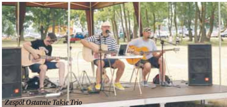
Zespół Ostatnie Takie Trio

Nieporęckie Lato Muzyczne zagościło w gminnym Kompleksie Rekreacyjno-Wypoczynkowym Nieporęt-Pilawa po raz pierwszy w ubiegłym roku. Ciekawe propozycje muzyczne spotkały się z żywym zainteresowaniem mieszkańców i turystów, stanowiąc atrakcyjne uzupełnienie oferty letniego wypoczynku. Organizator, Urząd Gminy Nieporęt we współpracy obecnie z DKK Krzysztof Kostro, postanowił kontynuować koncerty w nastrojowej scenerii Portu w Nieporęcie, zapraszając na wstępie do współpracy wykonawców związanych z Gminnym Ośrodkiem Kultury w Nieporęcie. Cykl muzycznych spotkań otworzył 11 lipca zespół Parafrasers, który zaprezentował rockowy repertuar i wiele znanych słuchaczom utworów. Dla dopełnienia przemielej