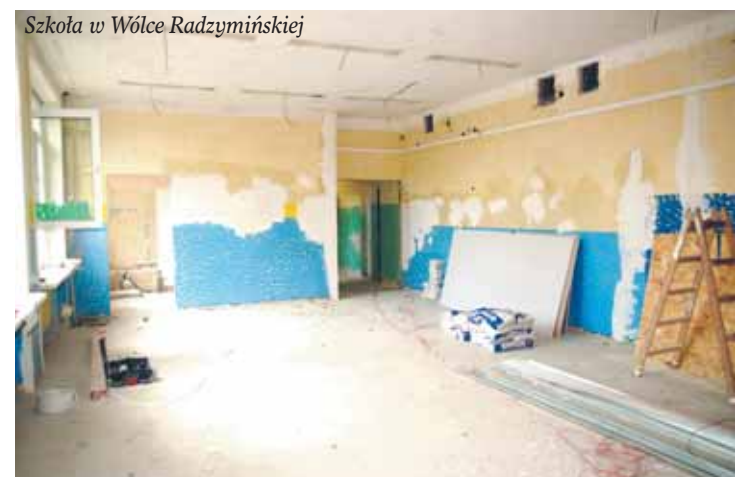
Szkoła w Wólce Radzywińskiej