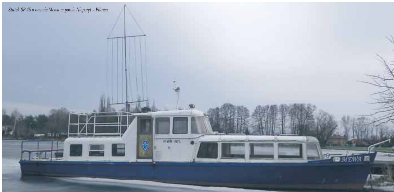
Statek SP-45 o nazwie Mewa w porcie Nieporęt - Pilawa

Rozwój żeglugi śródlądowej w latach 60. XX w. wymagał utrzymania w dobrym stanie dróg wodnych, do czego potrzebne były odpowiednie jednostki pływające. Jednym z zadań administracji wodnej są pomiary głębokości i wyznaczanie toru wodnego, do czego potrzebne są jednostki inspekcyjne.